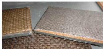
Pierre de Lin® : à gauche, plaque Nattex® + ardoise ; à droite, plaque Twinflax® + Liège + ardoise.

L'objectif était d'alléger la pierre tout en conservant sa solidité, en la renforçant de préférence avec des matériaux naturels. Résultat : une plaque Pierre de Lin® (base ardoise) pèse 28 kg/m 2 vs 90 kg/m 2 pour